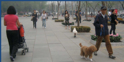
Hundeleben in Beijing

Bis in die neunziger Jahre war die Hundehaltung in Chinas Städten noch streng verboten. Hunde galten als „dekadent“, die knappen Lebensmittel reichten gerade für die Menschen. Mit wachsendem Wohlstand wächst die Begeisterung der Wohlhabenden in China an der Hundehaltung. Im Ausland herrscht immer noch die Meinung, Chinesen seien Hundeeßer, doch gehört das Haustier mittlerweile in vielen städtischen Familien zum guten Ton.